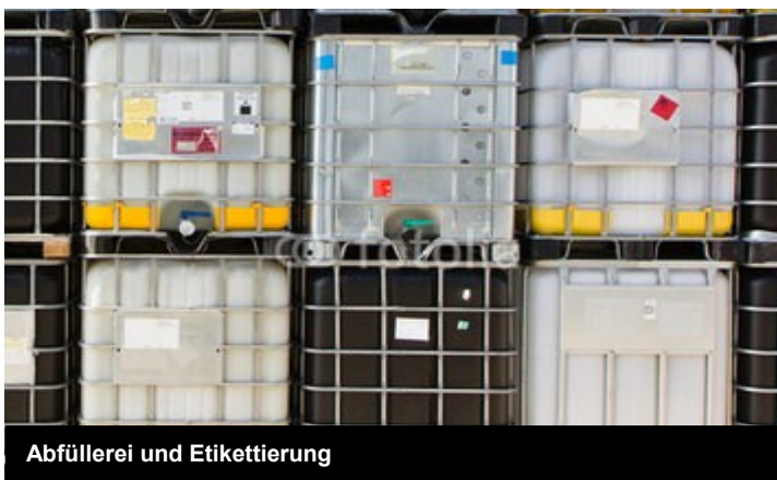
Abfüllerei und Etikettierung

Gebindegrößen von 30 ml – 6000 ml sind möglich für die verschiedene Flaschenformen.